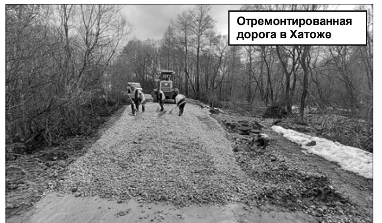
Отремонтированная дорога в Хатожке

промоин. Электрики следят за своим хозяйством, а именно, чтобы не было затопления трансформаторных подстанций и отключений населенных пунктов от электричества.