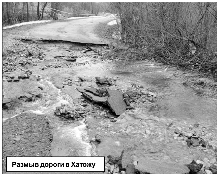
Размыв дороги в Хатожу

В кратчайшие сроки в районе промоины оборудован пешеходный переход, чтобы люди беспрепятственно могли переходить с одной стороны на другую. При наступлении хороших погодных условий, как только