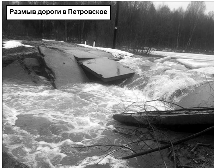
Размыв дороги в Петровское