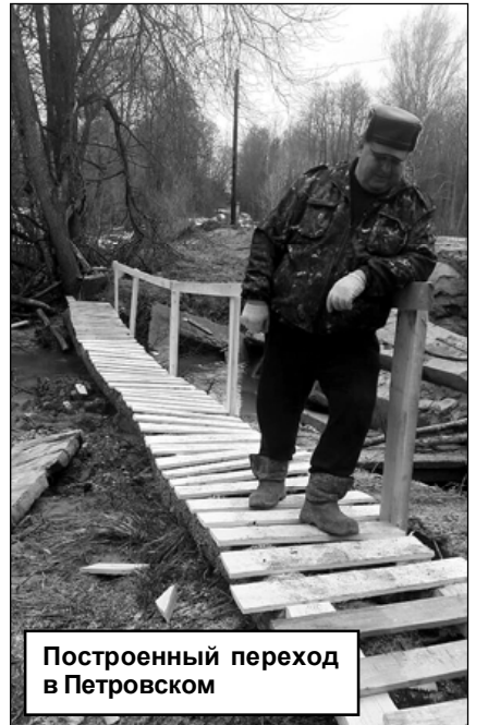
Построенный переход в Петровском

Второе серьезное повреждение дороги произошло в деревне Хатожка. Река постаралась и, полностью размыв дорогу, отрезала деревню от сообщения с районным центром.