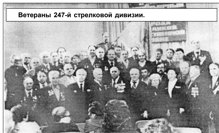
Ветераны 247-й стрелковой дивизии.

Жерелево. Главная задача, которую надо было решить жерелевским школьникам, - узнать имена погибших красноармейцев, а также имена тех, кто остался в живых.