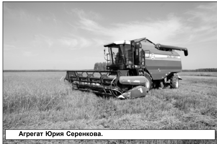
Агрегат Юрия Серенкова.

ли в поле в двадцатых числах июля, то сейчас из-за погодных катаклизмов на две недели позже.