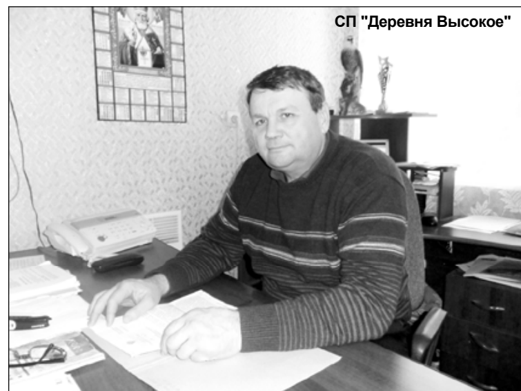
СП "Деревня Высокое"